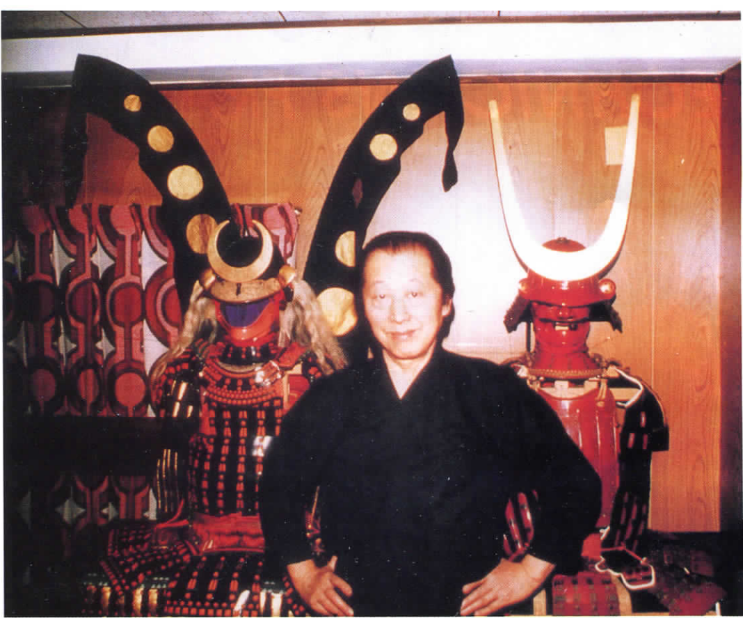
NAWA Sensei chez lui

L'usage du Manrikigusari ne doit pas être offensif,