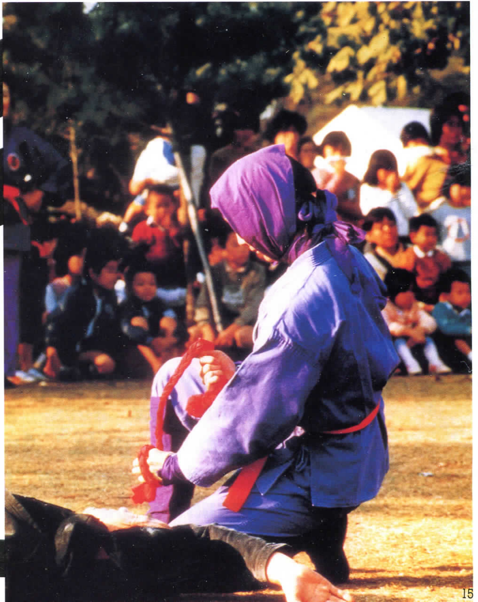
KUNOICHI Technique d'étranglement