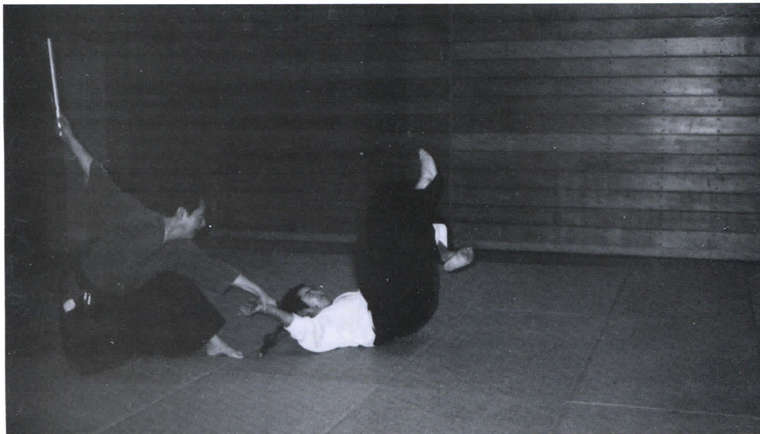
NAWA Sensei : chaîne et JUTTE projection.